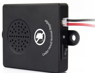
SMP AR05 Alarmă cu ultrasunete pentru capcană Ghidul utilizatorului

Importator; SMPower Kft 2310 Szigetszentmiklós, Csepeli út 15 www.smpower.eu